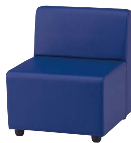
DLC-11L-S-IB(インディゴブルー)