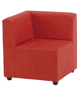
DLC-11CF-S-CR(カーマインレッド)